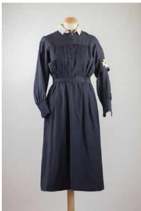
Bild 5 - Högtidsklänning