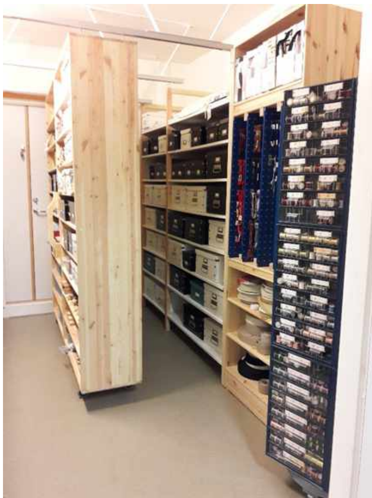
En av SVK:s två nya materialförvaringar. Specialbyggt för sybehör och tyglappar, med funktionen att komprimera skåpen som en "kompakta".