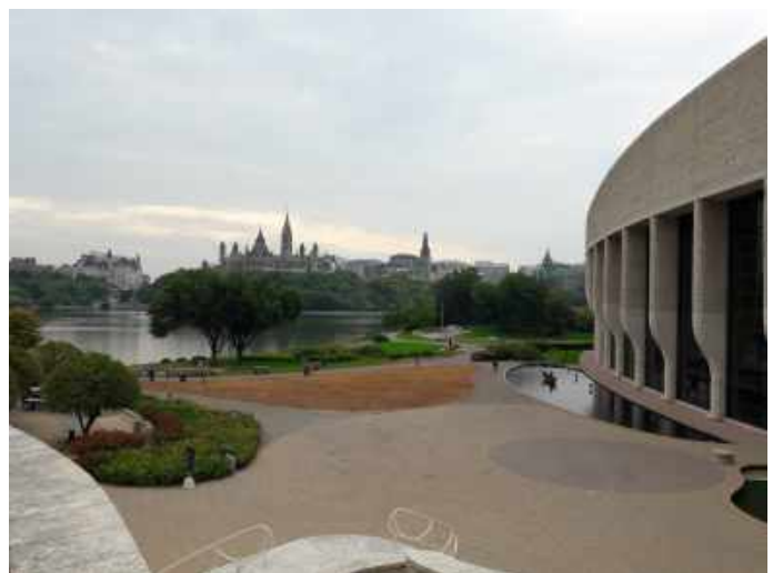
Utsikt mot parlamentet från trappan till The Canadian Museum of History

Museet har permanenta utställningar som handlar om Kanadas 20 000 åriga mänskliga historia som visas i The Grand Hall, the First Peoples Hall och the Canadian History Hall. Museet är en viktig forskningsinstitution med historiker, arkeologer, etnologer samt etnografer.