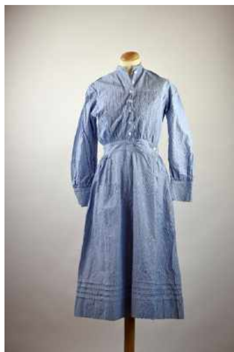
Bild 6 - Arbetsklänning