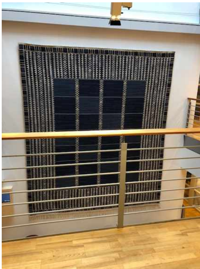
Matta Barbro Nilsson, MMF, 3,9 x 4,5 m arbetet utfört för Helsingborgs tingsrätt. Mattan har rengjorts och fått ett heltäckande stödtyg samt kanal för upphängning mot vägg. På bilden hänger mattan på plats.

• Samtidigt som årets besiktning av bockstensdräkten genomfördes för några dagar sedan, gjordes även provtagning på skilda